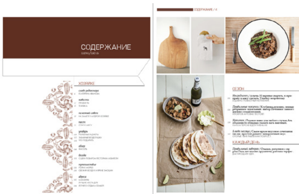
Рис. 3. Пример разворота с содержанием

Далее речь пойдет о подборе цветового решения. Так как цвет воздействует на чувства, а не на разум человека, нужно быть очень внимательным при выборе цветового решения любой полиграфической продукции [8]. Цвета, используемые в данном выпуске, будут как теплые, так и холодные. Например, темно-коричневый и бежевый цвета. Коричневый — цвет земли и древесных стволов будит воспоминания о камине и доме, а потому связан с представлениями о комфорте. Коричневый цвет облегчает выбор, так как считается вневременным, а также свидетельствуют об экологической чистоте [3]. А вот бежевый цвет — это всегда актуальная классика. Способен успокаивать, обладает теплой, тихой и спокойной энергетикой. За счет этих цветов можно создать приятную «домашнюю» атмосферу, которая привлечет представителя заданной фокус-группы, независимо от его гендерной принадлежности.