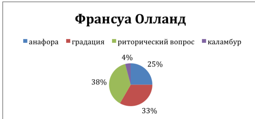
Рис. 1. Риторические фигуры в предвыборной речи Ф. Олланда

— Comment peut-on accepter que cette chance devienne une charge? — Как можно согласиться, чтобы этот шанс превратился в нагрузку? Каламбур во французском языке построен на близости звучания слов chance и charge .