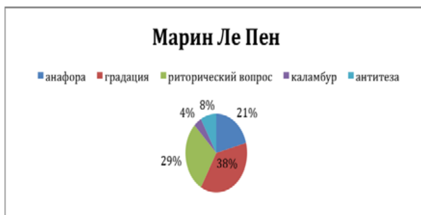
Рис. 2. Риторические фигуры в предвыборной речи М. Ле Пен

— Il n'est plus temps de pleurer sur le lait renversé, mais d'ouvrir enfin les yeux, de se retrousser les manches, de défendre nos valeurs et de prendre enfin les décisions qui changeront notre avenir. — Сейчас не время плакать над разлитым молоком (по басне Ж. Лафонтена «Кувшин молока»), а время открыть, наконец, глаза, закатить рукава, защитить наши ценности и принять, наконец, решения, которые изменят наше будущее.