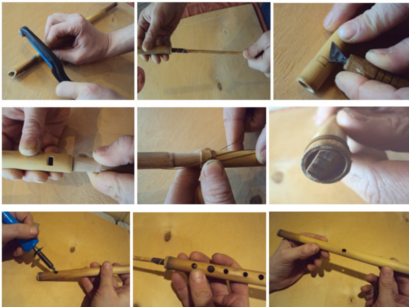
Рис. 4. Технология изготовления свирели