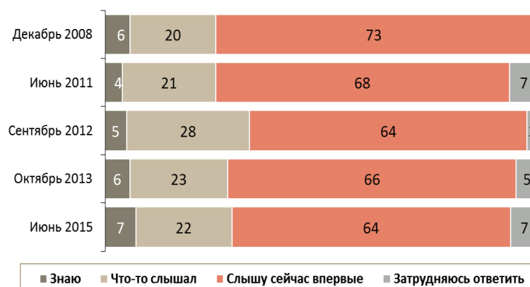
Рис. 1. Информированность россиян о социальном предпринимательстве — отсутствие роста

Россиянам задавался вопрос «Знаете ли Вы, что-либо слышали или слышите сейчас впервые словосочетание «Социальное предпринимательство»? (рисунок 1).