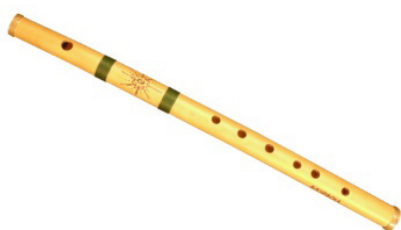
Рис. 1. Свирель