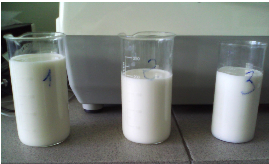
Рис. 1. Исследуемые образцы сырого молока