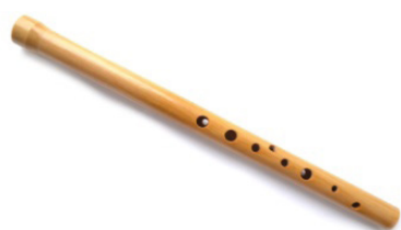
Рис. 2. Сопель