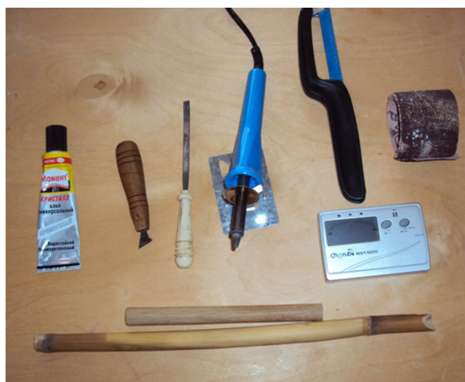
Рис. 3. Инструменты, необходимые для изготовления свирели