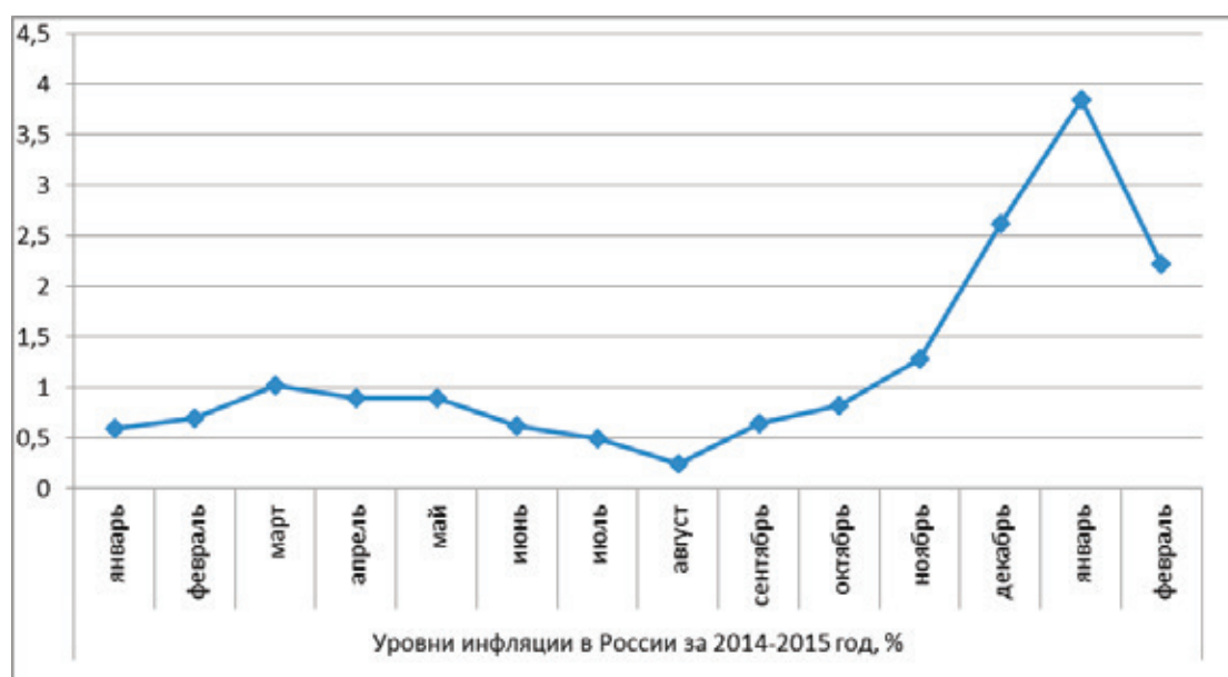
Рис. 1. Уровни инфляции в России

Экономическое положение России в 2015 г. можно охарактеризовать как кризис, вызванный внешними шоками: падением цен на нефть и санкциями, резко ухудшившими доступ к мировым рынкам капитала.