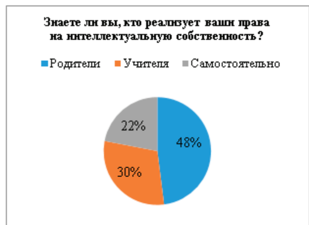
Рис. 2. Реализация прав несовершеннолетних на интеллектуальную собственность

(Рисунок 2) Ответы на второй вопрос показали, что большинство респондентов не знают, кто реализует их права на интеллектуальную собственность.