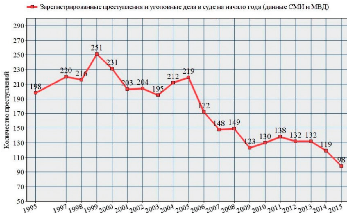
Рис. 1. Статистика преступлений по ст. 106 УК РФ за последние 20 лет

Как мы видим по новостям, сообщениям из сети «Интернет», трупы новорожденных младенцев находятся в общественных туалетах, мусорных баках, на улицах, в аэропорту, даже были случаи, когда мать оставила новорожденного ребенка на кладбище (в Самарской области, родив ребенка, 35-летняя женщина оставила ребенка на кладбище, сказав, что он родился мертвым [7]). Матери, которые по различным причинам не хотят воспитывать новорожденных младенцев, душат их, топят, бросают на улицах замерзать, бьют до смертельного исхода.