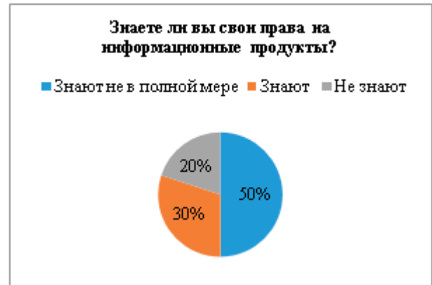
Рис. 1. Права несовершеннолетних на интеллектуальную собственность

Результаты анкетирования по первому вопросу представлены на рисунке 1: