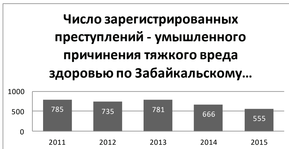
Рис. 2. Динамика умышленного причинения тяжкого вреда здоровью в Забайкальском крае

2015 г. — 555. Что соответствует общероссийской тенденции на снижение данного вида преступлений, однако не снижает его общественной опасности. (рис. 2).