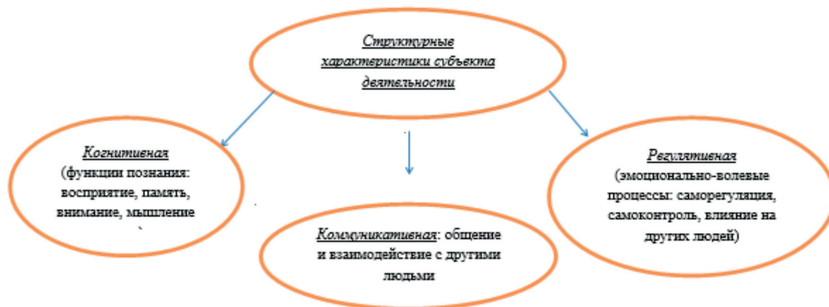
Рис. 1. Б. В. Ломов. Трактовка субъекта деятельности

В настоящее время формирование мобильности рассматривается с позиции компетентностного подхода. В определении сущности профессиональной мобильности, ее структурных компонентов большое значение имеет трактовка субъекта деятельности, предложенная Б. Ф. Ломовым (рис. 1):