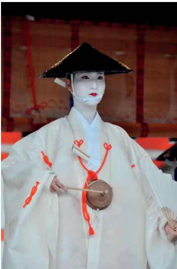
Рис. 2. Костюм в хэйанскую эпоху

В хэйанскую эпоху технологии окрашивания тканей и нанесения на них узоров были значительно упрощены по сравнению с технологиями периода Нара. Однако данная тенденция не означает падение уровня мастерства ткачей — она связана со сменой эстетических предпочтений их заказчиков. В Хэйан яркость и вычурность моды Нара отходят на задний план, и всё более начинают цениться приглушённые тона, скромность вышивки и изящные силуэты. Поэтому хэйанские ткани и костюмы можно назвать не столько менее богатыми, сколько более утончёнными в сравнении с ними же в предшествующий период.