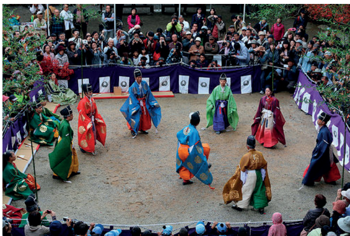
Рис. 3. Игра в кэмари в наше время

Непосредственно участвовать же аристократы не гнушались в кэмари — командной игре с мячом. Данное развлечение было столь популярно, что каждая знатная семья имела личное поле для кэмари.