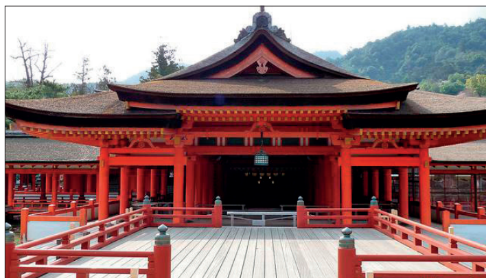
Рис. 1. Святилище Ицукусима

зоны занавесками, бамбуковыми или тростниковыми ширмами. Остальные комнаты отгораживались от синдэн и открытой веранды при помощи раздвижных деревянных ставней. В целом архитектуру жилых строений периода Хэйан можно назвать простой и минималистичной. На рис. 1 представлено святилище Ицукусима, построенное в стиле синдэн дзукури.