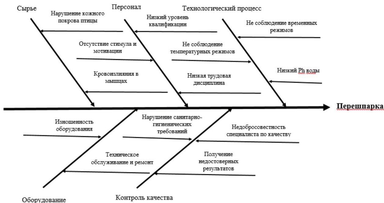
Рис. 3. Диаграмма Исикавы

Соответственно, для исключения такого дефекта тушки цыпленка-бройлера, как «перешпарка», необходимы следующие корректирующие действия: