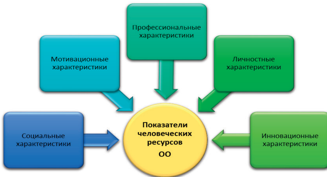
Рис. 2. Показатели человеческих ресурсов образовательной организации

участия в профессиональных конкурсах, а также инновационной деятельности учреждения в составе творческой группы.