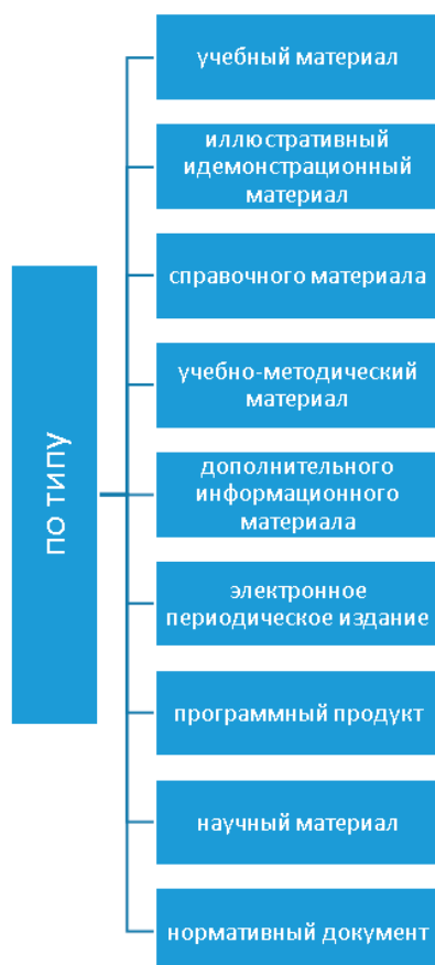
Рис. 1. Классификация по типу