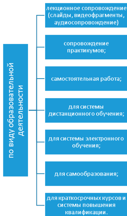
Рис. 3. Классификация по виду образовательной деятельности;