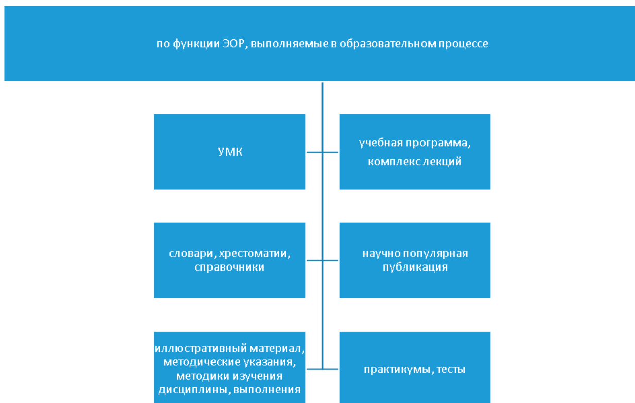
Рис. 2. Классификация по функции ЭОР, выполняемым в образовательном процессе