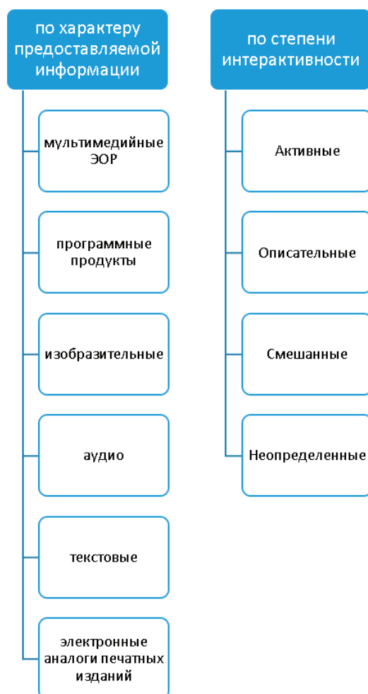
Рис. 4. Классификация по характеру предоставляемой информации и по степени интерактивности