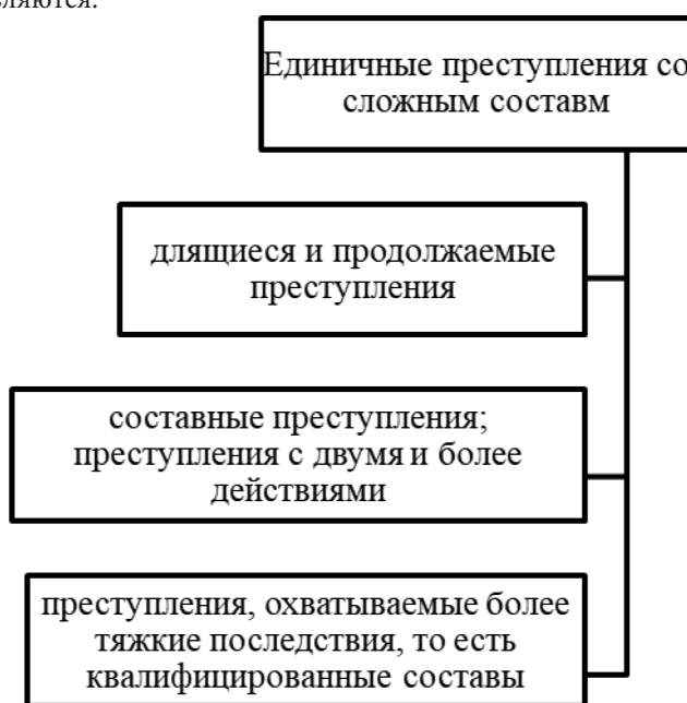
Рис. 1. Единичные преступления со сложными составами

Единичные преступления со сложными составами представлены на рис. 1.