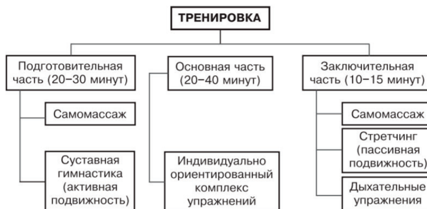
Рис. 1. Схематическая структура спортивных тренировок

В индивидуальные программы подготовки входит более 600 разных упражнений. Эти упражнения были систематизированы в кластеры по признакам развития определенных частей тела, уровня сложности и применяемого спортивного инвентаря. Подбор упражнений осуществляется таким образом, чтобы спортсмены могли идти по пути постепенного усложнения, выполняя упражнения в узком пространстве в домашних условиях. На рис. 1 изображена общая схема проведения спортивных тренировок.