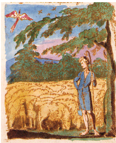
Рис. 1. Иллюстрация к стихотворению У. Блейка «The Shepherd»

Ментальное пространство, сформированное в процессе восприятия иллюстрации, содержит следующие смыслы гармония, жизнь, нежность, тепло . Благодаря общим компонентам-смыслам ( тепло, гармония, нежность ) два исходных пространства взаимодействуют и образуя пространство-бленд, в котором компоненты приобретают новые смыслы: гармония природы созвучна гармонии отношений пастуха и стада; во всем царит атмосфера тепла, нежности и любви (пастух нежно любит своих овец; овцы-родители нежно любят своих ягнят; Бог нежно любит людей). Мир в этой пасторальной зарисовке абсолютно гармоничен: пастух и овцы (Бог и люди) — две взаимосвязанные части мира, согласие между ними означает полное равновесие в мире и совершенство установленного порядка. Время в пасторали абсолютно мифично, это состояние определено категорией «всегда» ( from the morn to the evening, all the day ). Такая временная стабильность и позволяет видеть в картинке ситуацию библейского мифа.