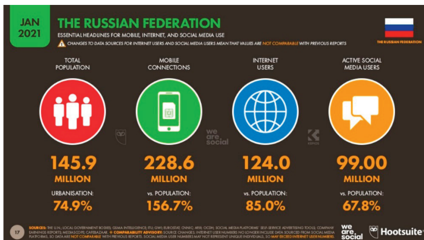
Рис. 2. Ключевые данные «цифрового состояния» России на январь 2021 года [2]

По состоянию на январь 2021 года население Российской Федерации составляет 145,9 миллиона человек. В январе 2021 года в России насчитывалось 228,6 млн мобильных устройств с выходом в интернет. Количество мобильных подключений по отношению к общей численности населения России составило 156,7%, у многих людей более одного мобильного устройства с выходом в интернет. На начало 2021 года в России насчитывается 124 млн (85%) пользователей интернета. В период с 2020 по 2021 год количество пользователей интернета в Российской Федерации увеличилось на 6,0 млн (+ 5,1%). В январе 2021 года в Российской Федерации насчитывалось 99 млн пользователей социальных сетей, за 2020 год аудитория соцсетей выросла на 4,8 миллиона (+ 5,1%).