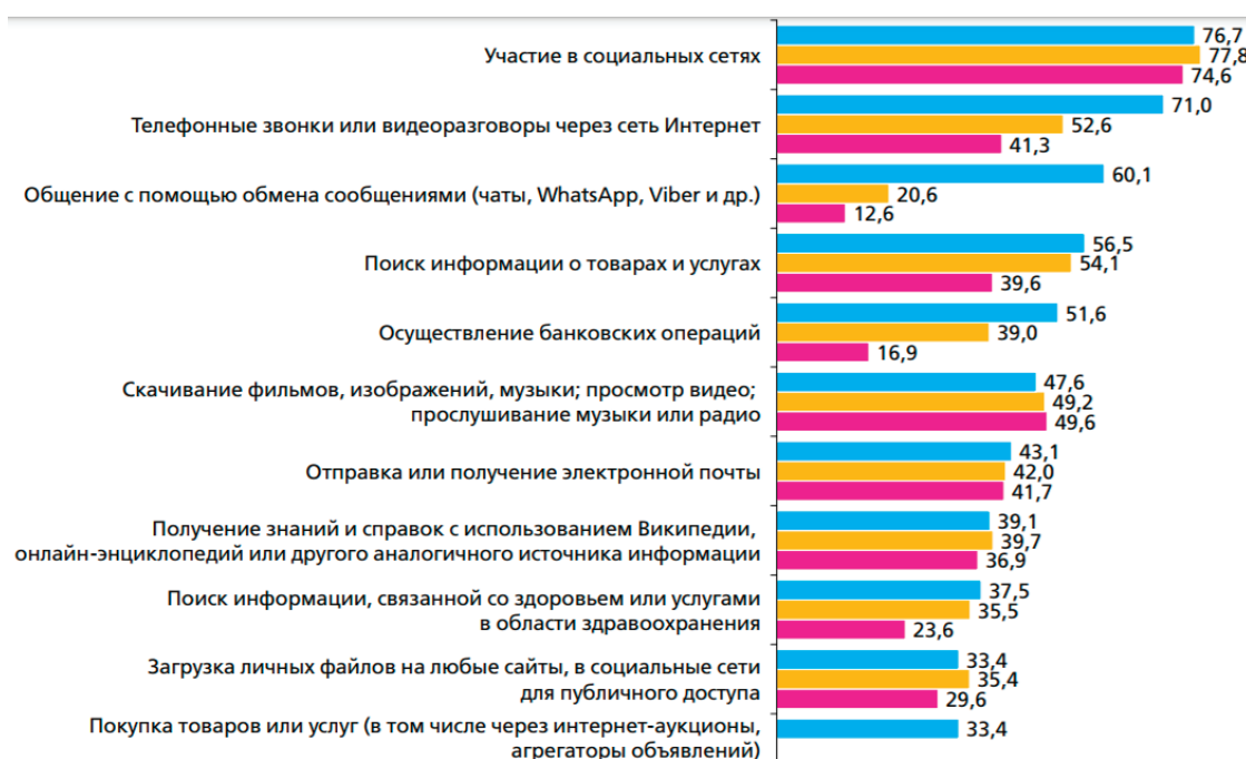
Рис. 3. Цели использования сети «Интернет» населением России [3]

Указанные статистические данные информируют о том, что 85% населения России так или иначе пользуются интернет-пространством. Одной из проблем свободного размещения информации в интернете является, её использование в непра-