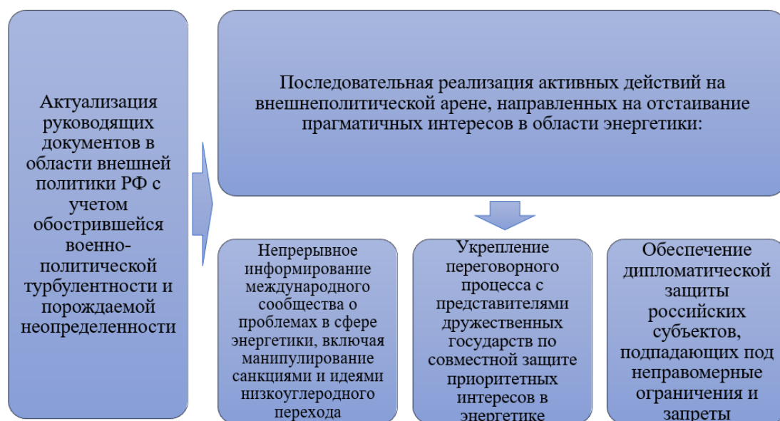
Рис. 2. Система мер по формированию и совершенствованию внешней энергетической политики России в актуальных условиях [Составлено автором]

На рис. 2 предлагается разработанная автором система мер по формированию и совершенствованию внешней энергетической политики России в актуальных условиях.