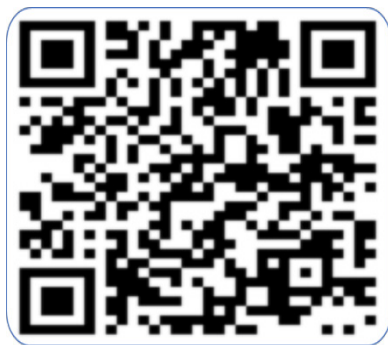
Рис. 1. QR-код видео-урока

Данные методы позволят учащимся не просто читать готовый материал из учебника, но и исследовать данную тему самостоятельно, познавать что-то новое. Обучение при помощи информационно-коммуникационных технологий даст учащимся возможность в выборе времени для прослушивания данного курса, а также полную визуализацию изучаемой темы.