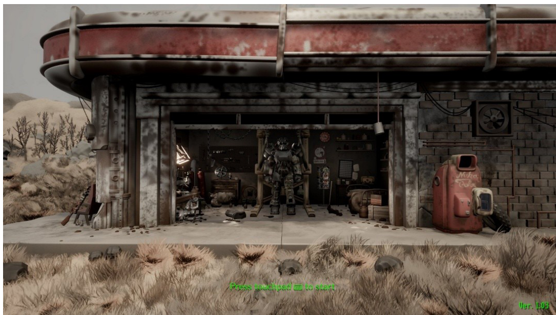
Рис. 1. Fallout 4: Dreams Edition (1.03). [3]

на официальном сайте видеоигры Грезы (Dreams), в котором реализовал многие геймплейные особенности и ключевые механики Fallout 4. Игра, к примеру, поддерживает вид от первого лица, стрельбу, рукопашный бой, диалоги с выбором реплик и систему инвентаря. Помимо прочего, другие игроки могут использовать полученный результат в своих творениях. К примеру, эту видеоигру использовали в 340 творениях. Вот, наглядный пример, получившегося произведения, которое в точности повторяет один из узнаваемых визуальных элементов (изображений и дизайна) видеоигры Fallout 4: