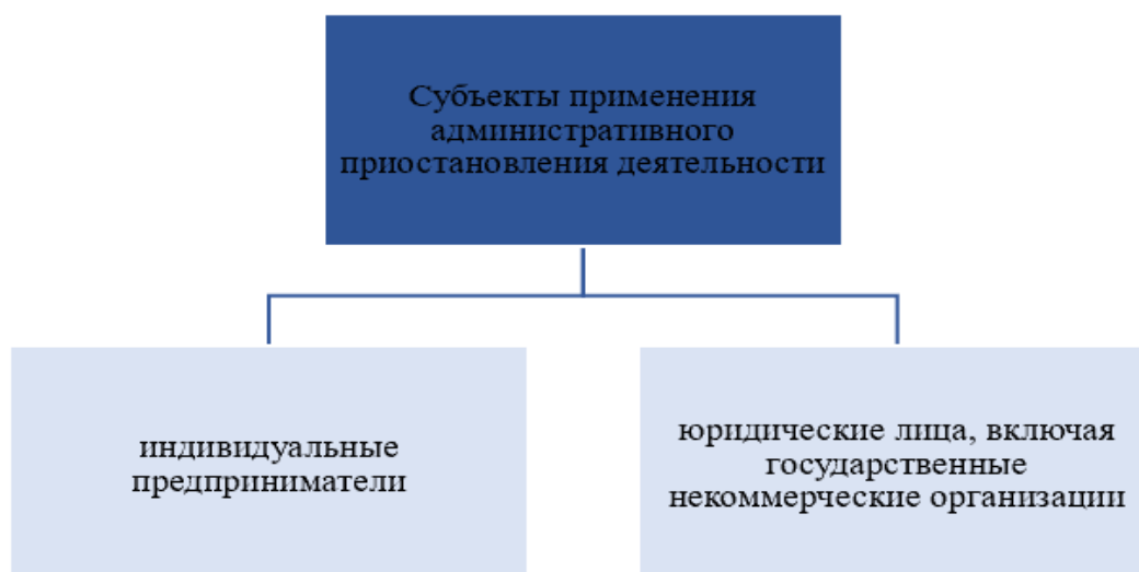
Рис. 3. Субъекты применения административного приостановления деятельности

принимателя может составить до полумиллиона рублей, а для юридического лица — до миллиона; согласно ч. 2 ст. 6.33 КоАП РФ, соответственно — до шестисот тысяч рублей и до пяти миллионов рублей.