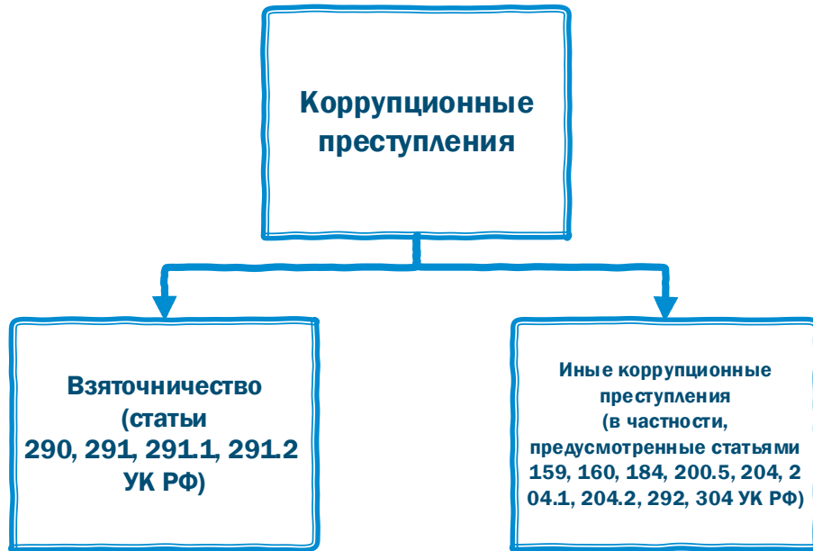
Рис. 1. Дифференциация коррупционных преступлений