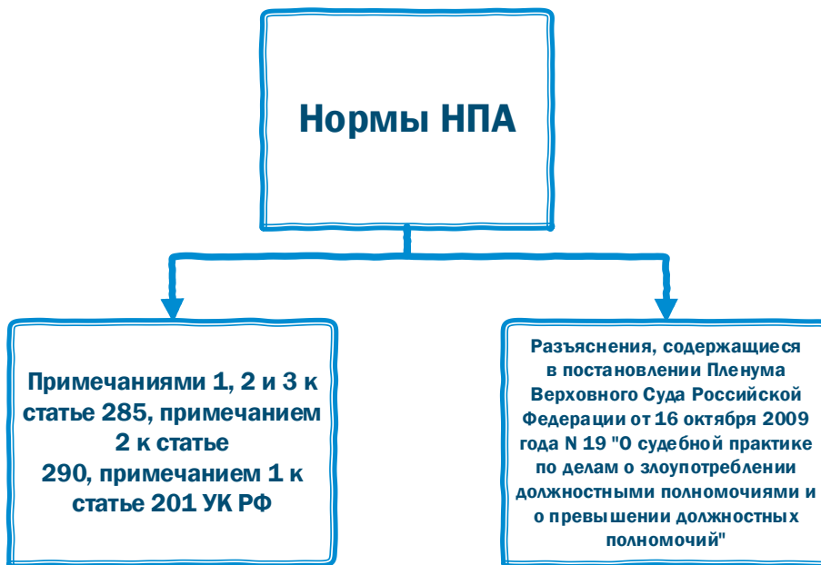
Рис. 2. Используемые нормы

тересам граждан, организаций, общества, государства понимают преступления против государственной власти, интересов государственной службы, службы в органах местного самоуправления, предусмотренные статьями 285–293 гл. 30 Уголовного Кодекса РФ.