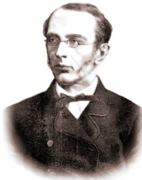
Рис. 1. К. П. Победоносцев в 1850-е — 1860-е годы

Во-первых, важно обратить внимание, что учился он в училище правоведения в Петербурге с 1841 по 1846 год, где впитал