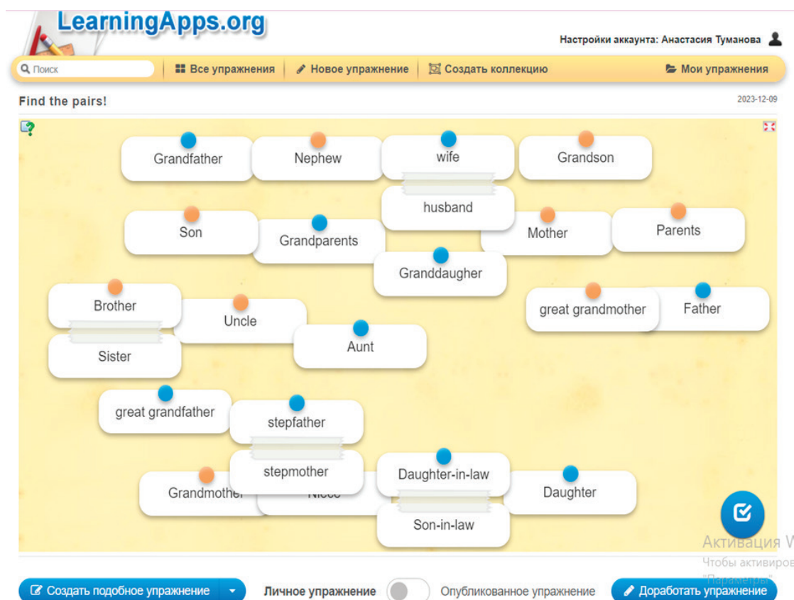
Рис. 1. Упражнение «Найди пару»

УМК «Forward Английский язык 6 класс» авторства М. В. Вербицкой, М. Гаярделли, П. Редли, Л. О. Савчук является одним из учебных пособий для изучения английского языка в шестом классе. Данный УМК по английскому языку состоит из учебника и рабочей тетради, а также аудиозаписей, приложенных к рабочей тетради и к учебнику. В УМК представлены различные уроки, тексты, упражнения и задания, предназначенные для обучения английскому языку. УМК создан для учащихся шестого класса, адаптирован для данного возрастного уровня. Представляет основные аспекты изучения английского языка, включая грамматику, словарь, чтение, письмо и разговорную речь. В книге для учителя «Forward