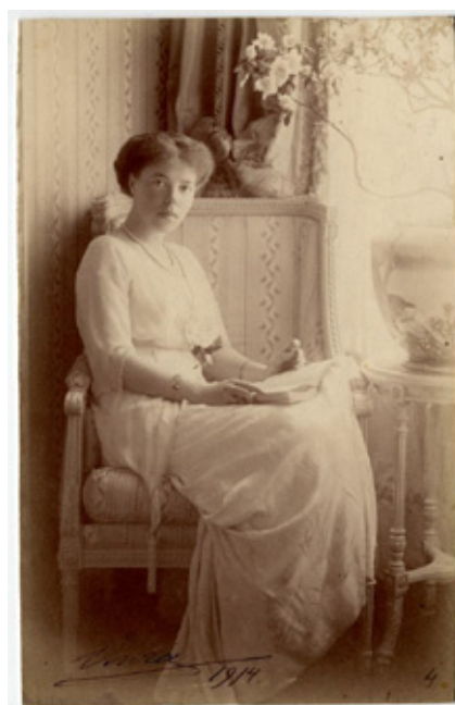
Рис. 1. Ольга Александровна Романова

В 1914 году Великая княгиня Ольга Александровна, сестра Николая II, также ушла на фронт служить сестрой милосердия. Вскоре, на свои собственные средства, она построила госпиталь в Киеве. Ольга Александровна была шефом Ахтырского полка. Все раненые ахтырцы попадали к ней в госпиталь, и она собственноручно обмывала больных, перевязывала раны.