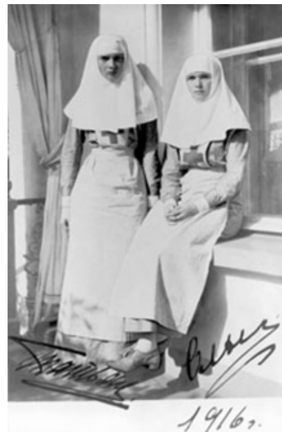
Рис. 2. Сестры милосердия Российского Общества Красного Креста. 1916 г.

лучение продуктов, раздача пищи и многое другое. После июньского отпуска в родное Константиново, Сергей Есенин вернулся в Царское Село и продолжил военную службу в канцелярии Феодоровского собора, исполняя одновременно обязанности санитаров лазарета № 17 имени Великих Княжен Марии и Анастасии. Во время первой мировой войны немцы впервые применили удушливые газы, принесшие много страданий солдатам. Общество оперативно организовало в Москве и Петрограде мастерские по изготовлению средств защиты и вскоре направило на фронт около 10 миллионов противогазов-повязок и около 6 миллионов фильтровальных противогазов. Для борьбы с эпидемиями Российское Общество Красного Креста (РОКК) создало 36 санитарно-эпидемиологических и 53 дезинфекционных отряда, 11 бактериологических лабораторий. Для организации хирургической помощи сформированы летучие хирургические отряды. Для эвакуации раненых были также приспособлены госпитальные суда «Португаль», «Экватор», «Вперед» («Португаль» и «Вперед» были потоплены немцами), баржи. [5]