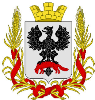
Рис. 3. Проект герба г. Якутска 1875 г.

ской империи, а соболь в лапах представлял ясак, «мягкую рухлядь» ( Мягкая рухлядь — название пушнины, выделанных шкур пушных зверей, используемых для производства меховых изделий) которую местное население вынуждено было платить служивым людям в острогах, коим и являлся на то время Якутск. В конце XVIII в. Якутская область Иркутской Губернии была диким краем ценными метрополии только по пушнине, добываемой здесь и нет ничего удивительно в том, что автор герба решил выделить данную особенность края. Этот герб просуществовал без изменений до революции 1917 г. Хотя остались све-