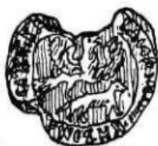
Рис. 1. Печать Якутского острога

Охарактеризовать герб города Якутска от 1790 года можно как очень лаконичный и гармоничный в своей простоте. Нет ни одного лишнего элемента. Серебряное поле должно было символизировать чистоту и невинность края, орёл вполне возможно обозначал восточную часть Россий-