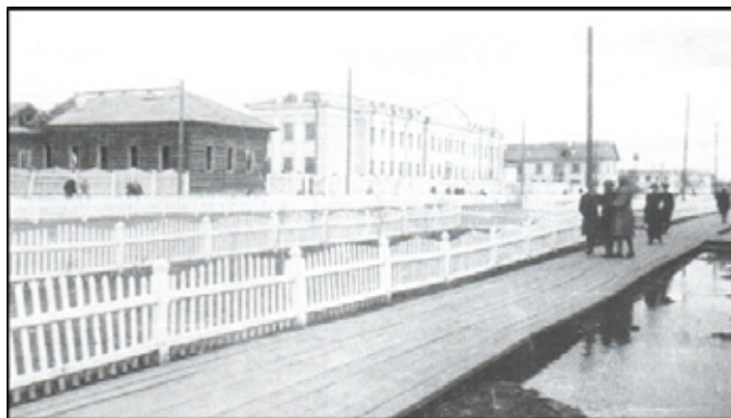
Рис. 1. Здание средней школы №8, год открытия — 1941

Одессы» и др. Регулярно выпускались стенгазеты — общешкольные, классные.