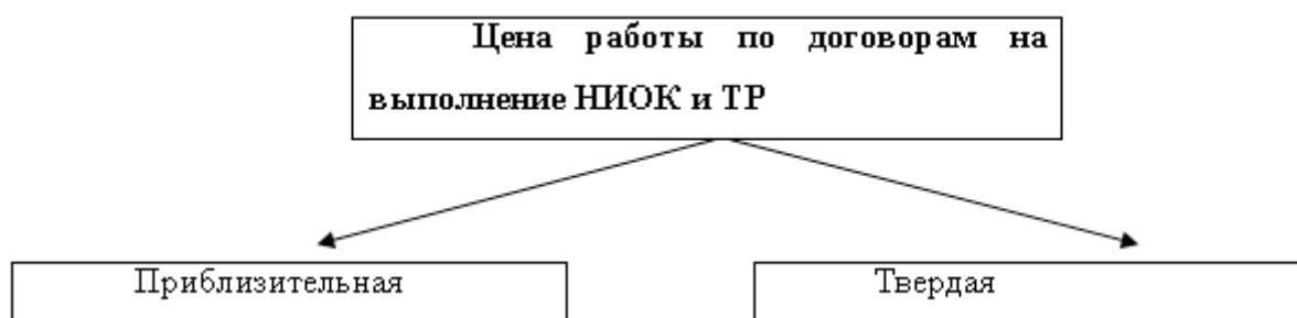
Рис. 2. Цена работы по договорам на выполнение НИОК и ТР

В рассматриваемом разделе договора предусматривается порядок и сроки оплаты работ.