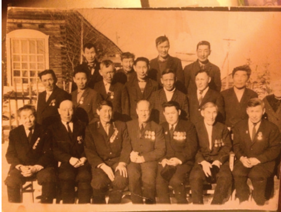
Рис.2. Фронтовики. Сунтарский район ЯАССР