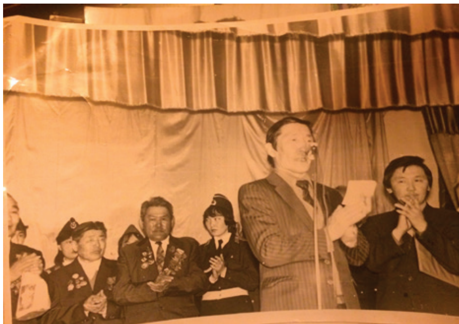
Рис.3. День Победы. Сунтарский район ЯАССР