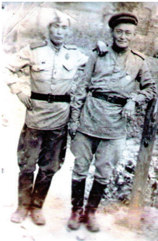
Рис.2. Ол уоттаах сэрии түгэннэрэ

дратьев С.А. 669886 № -дээх Албан аат III степеннээх уордьанынан наҕараадаланарын туһунан 129 Орловской стрелковой дивизия 1944 сыл атырдыах ыйын 11 к. Бирикээһигэр баар.