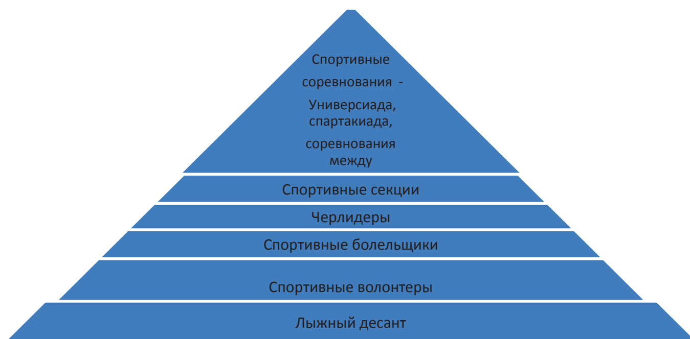
Таблица 1. Модель интеграции студенческой культурно-досуговой деятельности в сфере физической культуры и национальных видов спорта

Одной из задач является организации физкультурно-оздоровительной работы со студентами разных факультетов и институтов. С этой целью в университет реализуется проект лыжный десант «Үргэл», который отметил 50-летний юбилей. Во время лыжного десанта по республике проводится профориентационная работа со старшеклассниками по военно-патриотическому воспитанию, проведение лекций по ЗОЖ, совместных культурно-массовых мероприятий.