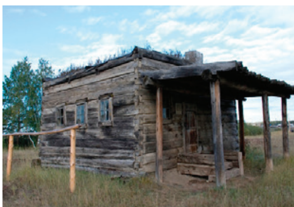
Рис.2. Срубный дом «Ампаар дьээ»

В 1925—1926 гг. медико-санитарный отряд Якутской комплексной экспедиции АН СССР обследовал семейно-бытовые и санитарно-гигиенические условия обитания жителей Вилюйского и Олекминского округов. Необходи-