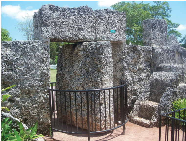
Рис. 3. Вход в Коралловый замок

шесть мужчин и подъемный кран, чтобы исправить, как тогда казалось образовавшуюся проблему. После этого дверь перестала и вовсе открываться. Был нарушен идеальный центр тяжести, позволяющий работать многотонным дверям. Хочется отметить небольшой, но весомый факт из биографии «угрюмого Эда»: рост его не превышал 152 см, а вес 54 килограмма. Как ему, далеко не великану, удалось в одиночку построить это сооружение?