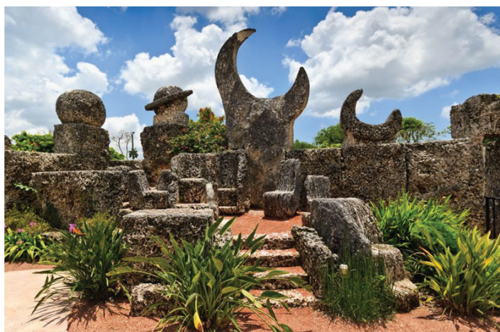
Рис. 1. Один из уголков Кораллового замка

в постройке этого замка есть немало загадок и поныне — уж очень оно экзотическое это сооружение, приковывающее к себе внимание абсолютно всех посетителей.