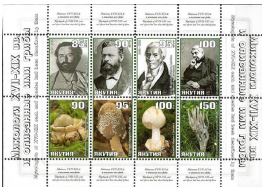
Рис. 3. Микологи XVII–XIX вв. и описанные ими грибы. Почтовый блок Республики Якутия

новил две различные болезни, поражающие червей и раз- работал эффективные способы борьбы с ними.