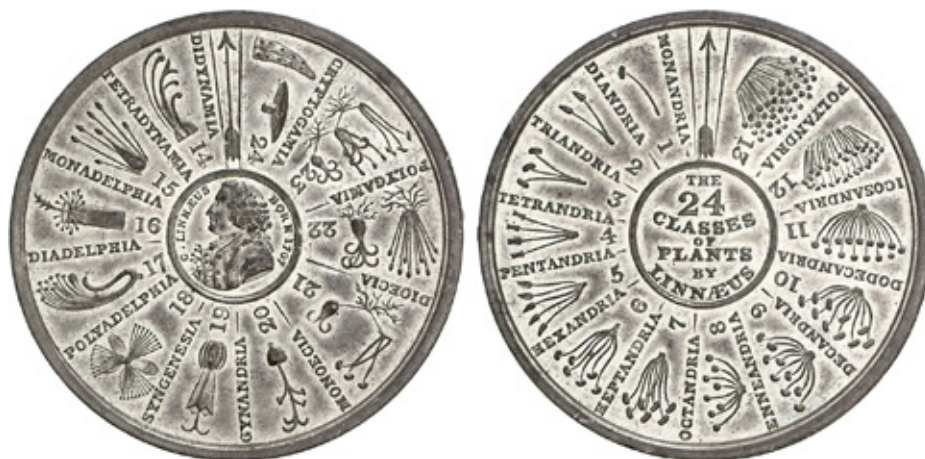
Рис. 1. Половая система растений Линнея. Медаль Великобритании

алов. Областью изучения филателии самым непосредственным образом является история почтовой связи [6].