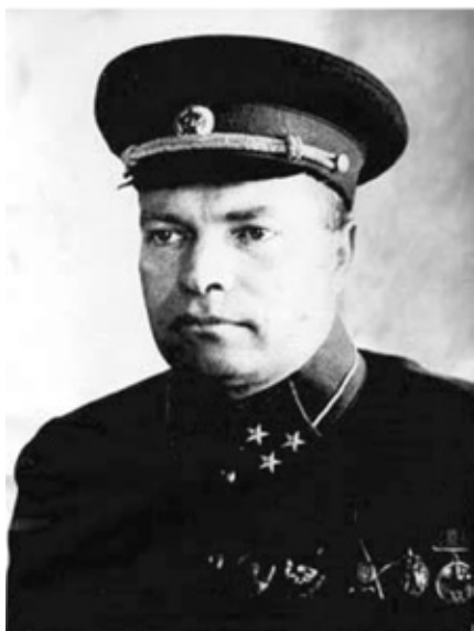
Генерал-лейтенант И.И. Масленников