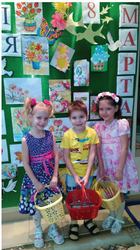
Рис. 1. Праздник 8 марта

1. Осознание себя, своего «Я» начинается с работы над собственным именем, с понимания того, что каждый ребенок имеет свое имя. Обсуждение с детьми и родителями: почему выбрано данное имя, как ласково назвать