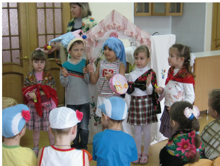
Рис. 5. «Масленица»