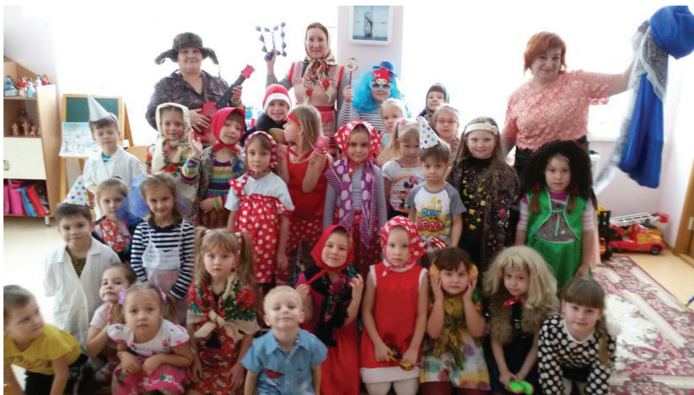
Рис. 6. «Колядки»