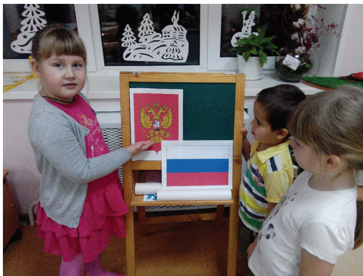
Рис. 2. Занятие с использованием материалов из нравственно-патриотического уголка

создана богатая предметно-развивающая среда — функционирует уголок нравственно-патриотического воспитания, где собраны различные материалы: альбомы, книги, иллюстрации, открытки, символика Старооскольского городского округа, Белгородской области, страны и т.д. Уголок постоянно пополняется новыми материалами, пособия готовятся совместно с родителями и детьми. Работа над геральдикой (изучение герба, флага) заключается в осознании ребенком смысла, значения знаков и символов, отражающих что-то главное.