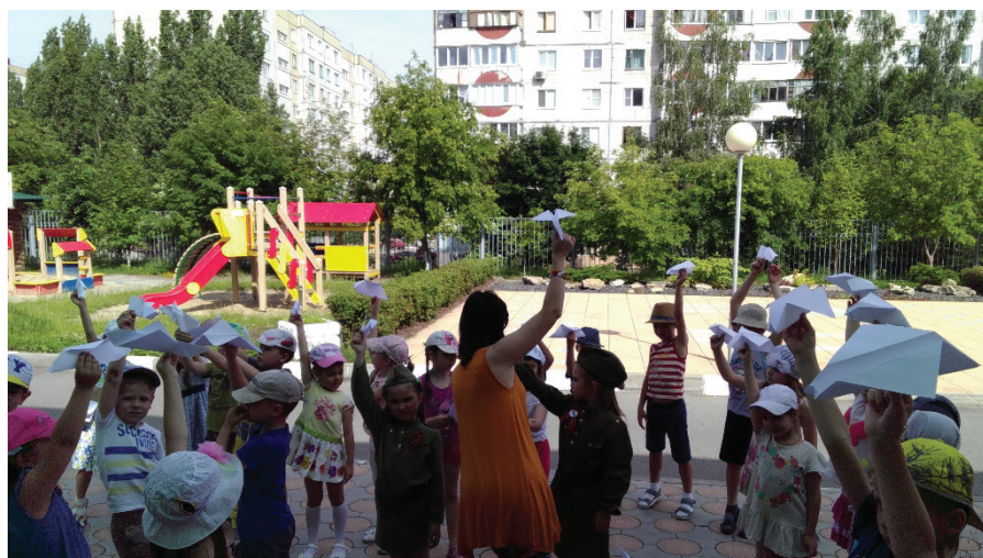
Рис. 3. День памяти и скорби (День начала ВОВ)

5. Непосредственное участие дошкольников в мероприятиях, посвященных важным датам (День города, День освобождения Старого Оскола от немецко-фашистских захватчиков, День защитника Отечества, День Победы). Дети делают открытки, поздравления, подарки, выступают на утренниках. В результате такой работы у дошкольников создаются не только представления об их городе, стране,