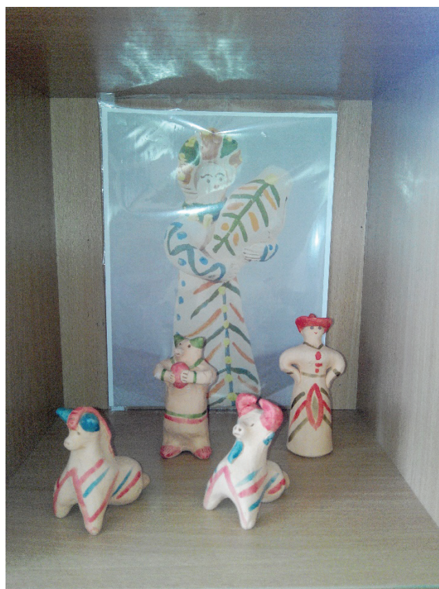
Рис. 7. Мини-музей «Старооскольская глиняная игрушка»

ности родного города» «Наша Родина — Россия», «Москва-главный город нашей Родины», «Государственные символы России», «Русская матрешка», «Люблю берёзу русскую...», «Большая и малая-Родина», «Поклонимся великим тем годам...», «Мы дружбою сильны», «Бравые солдаты» и др.