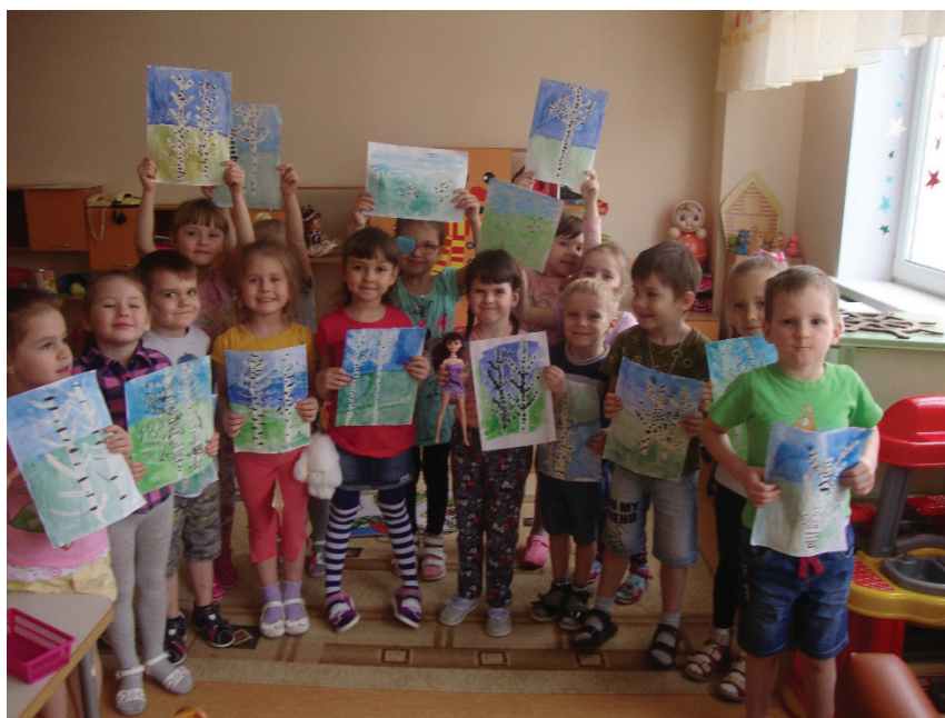
Рис. 4. Организованная образовательная деятельность «Люблю берёзу русскую...»

В рамках образовательной области «социализация» с целью овладения детьми знаниями о культурных ценностях, традициях была организована образовательная деятельность: «Моя мама», «Дружная семейка», «Род и родословие», «Родной город», «Достопримечатель-