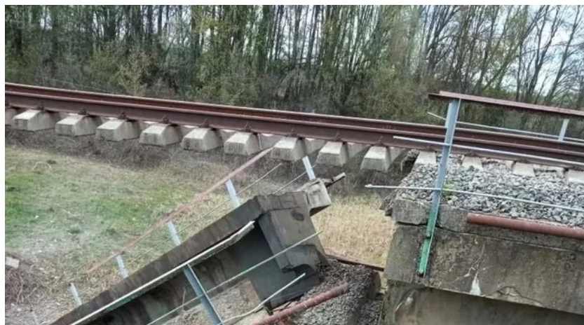
Рис. 1. Разрушение моста в Курской области в 2022 году

Как видно из примеров при разрушении моста повреждается опора и разрушается балласт, но сам рельсовый путь за счет крепления накладками остается не поврежденным и поезд при проследовании по такому пути неминуемо обрушится вниз.