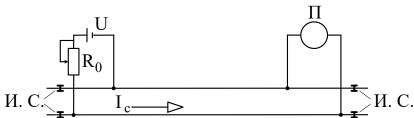
Рис. 4. Схема рельсовой цепи

Для предотвращения таких происшествий предлагается использовать специальный датчик контроля повреждения конструкции моста. Датчик построен на базе рельсовой цепи. Схема рельсовой цепи представлена на рисунке 4.