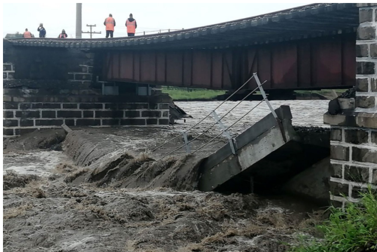
Рис. 2. Разрушение моста на Транссибирской магистрали в 2021 году

Машинист поезда, приближающегося к такому мосту, не всегда может определить аварийную ситуацию. Ему могут помешать условия видимости или невнимательность. Если машинист заметит разрушение моста, у него не всегда будет достаточно времени успеть затормозить, поскольку тормозной путь поезда может превышать 1 км. Последствия такого крушения показаны на рисунке 3. Крушение произошло в Индии 2 (.07.2015) пассажирский поезд упал в канал в Гуджанвале из-за обрушившегося моста, погибло 18 человек.