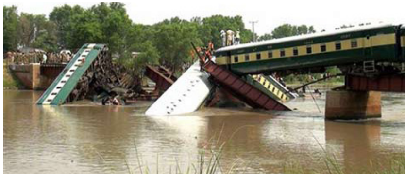
Рис. 3. Крушение поезда на мосту в Индии в 2015 году

Машинист поезда, приближающегося к такому мосту, не всегда может определить аварийную ситуацию. Ему могут помешать условия видимости или невнимательность. Если машинист заметит разрушение моста, у него не всегда будет достаточно времени успеть затормозить, поскольку тормозной путь поезда может превышать 1 км. Последствия такого крушения показаны на рисунке 3. Крушение произошло в Индии 2 (.07.2015) пассажирский поезд упал в канал в Гуджанвале из-за обрушившегося моста, погибло 18 человек.