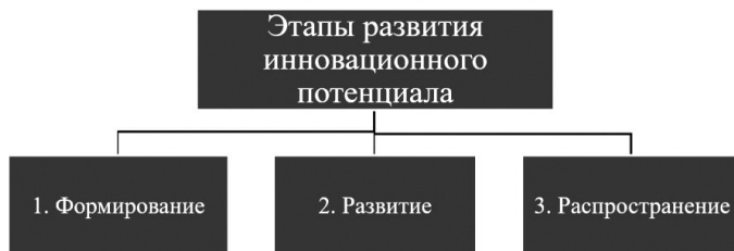
Рис. 1. Этапы развития инновационного развития

Процесс формирования инновационного потенциала происходит не сразу и не мгновенно, он претерпевает несколько этапов на протяжении длительного времени (рис. 1).