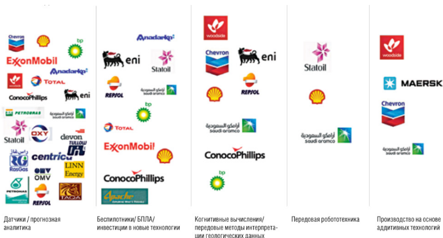
Датчики / прогнозная аналитика