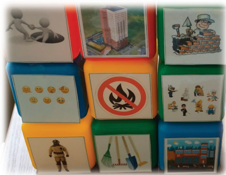
Рис. 1. «Кубики историй» по теме «Профессии»

Когда кубики готовы, не стоит сразу все использовать в игре. Начните с трёх кубиков. Даже при таком небольшом количестве, возможны различные варианты. Если играет один ребёнок, то он бросает кубик с изображением профессий. Например, на верхней грани кубика изображён врач, значит на остальных кубиках дошкольник выбирает картинки, которые относятся к данной профессии, и составляет одно или несколько предложений. Например, врач работает в поликлинике, его профессиональная одежда — белый халат.