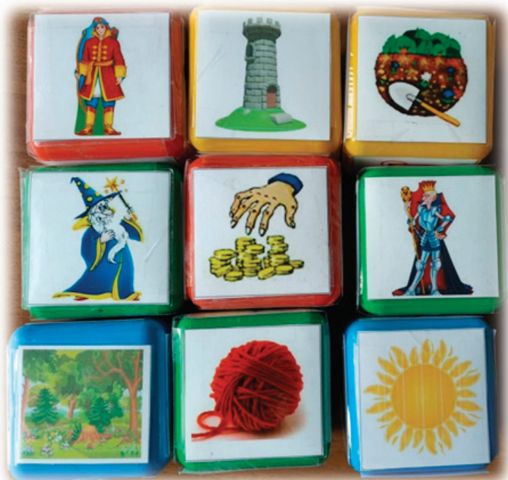
Рис. 2. «Кубики историй» для сочинения сказок

Можно усложнять работу с «Кубиками историй», размещая на гранях знак вопроса, чтобы воспитанники проявляли творчество и инициативу, сами придумали, часть сюжета.