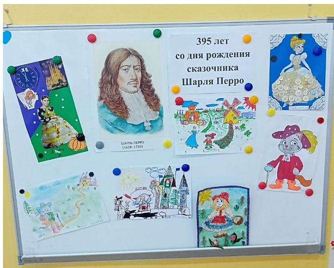
Детские презентации семейных творческих работ по сказкам Шарля Перро