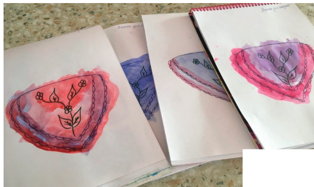
Рис. 2. Непосредственно образовательная деятельность: рисунки «Платок для бабушки» по сказке «Маша и медведь»

Не обошлось и без конструктивной деятельности, на которой ребята с помощью крупного конструктора соорудили Теремок и заселяли в него героев одноименной сказки.