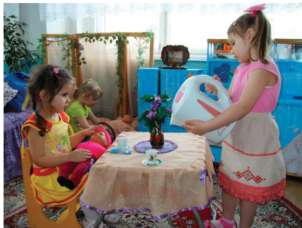
Рис. 2. Сюжетно-ролевая игра «Дочки-матери»

Одними из самых любимых видов деятельности у детей в детском саду детей являются музыкальные занятия. Давно доказано, что двигательная активность под музыку усиливает обмен веществ в организме, повышает общий тонус, улучшает деятельность сердечно-сосудистой системы, регулирует нервную деятельность, развивает силовые возможности детей. При работе