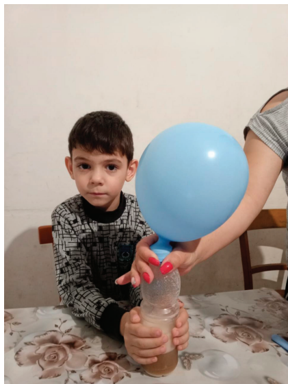
Опыт с содой и уксусом