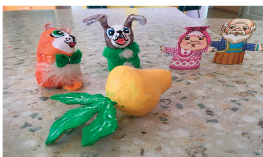
Рис. 3. Использование разных видов театра

Наиболее яркими событиями проекта конечно же была инсценировка сказки «Репка» совместно с родителями, а также литературный видео-челлендж «Читаем