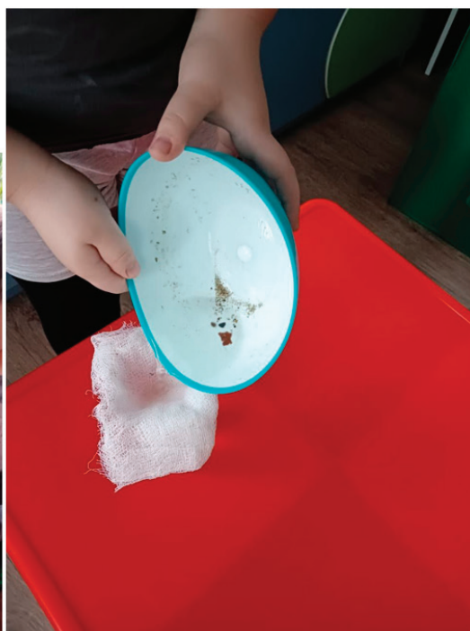
Какой же грязный этот чистый белый снег