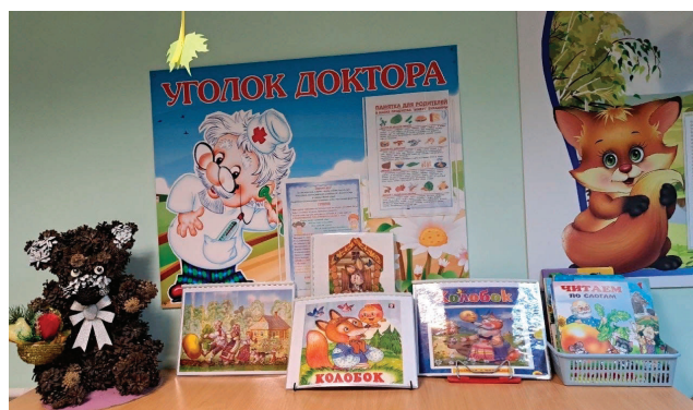
Рис. 4. Выставка книжек и поделок по русским народным сказкам