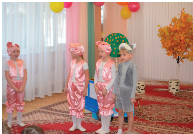
Рис. 4. Инсценировка сказки «Три поросенка»