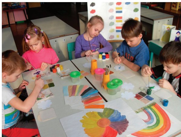
Рис. 3. Занятие по арт-терапии