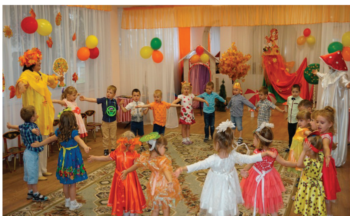
Рис. 5. Хоровод «Осень красавица»

с детьми с ОВЗ педагоги используют метод реабилитации — музыкотерапию. Этот метод позволяет использовать разнообразные музыкальные средства для психолого-педагогической и лечебно-оздоровительной коррекции личности, развития её творческих способностей, интеллектуальной сферы. Коррекционно-музыкально-игровые занятия стимулируют умственные и физические возможности ребенка, помогают преодолению имеющихся у него нарушений в соответствии с его возможностями.