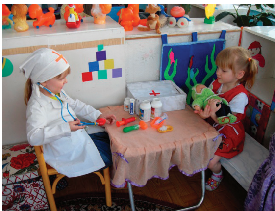
Рис. 1. Сюжетно-ролевая игра «Поликлиника»

Основной вид деятельности детей дошкольного возраста — это игра. Играя, дети учатся, развиваются, общаются, оздоравливаются. Комплекс социально-культурных реабилитационных технологий, в основе которых лежит использование игры, — это игротерапия. Игротерапия позволяет развивать психические процессы: внимание и память, развивать умственную деятельность, воображение, речь, опорно-двигательный аппарат. Игры воспитывают, развивают, социализируют ребенка. В игре ребенок может быть зрителем, участником под руководством взрослого или самостоятельным участником ролевой игры.