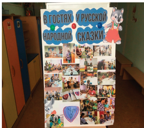
Рис. 5. Информационный стенд «В гостях у русской народной сказки».

руем это на рис. 5., который в течение проекта пополнялся фотографиями и рисунками детей и родителей. По окончании проекта, мы с ребятами еще долго вспоминали об интересных и познавательных мероприятиях в рамках проекта «В гостях у русской народной сказки».