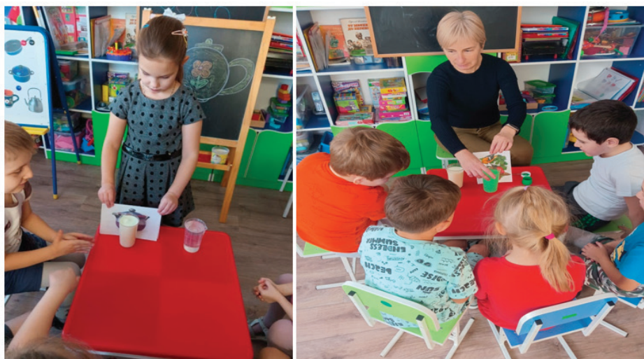
Какого цвета вода?