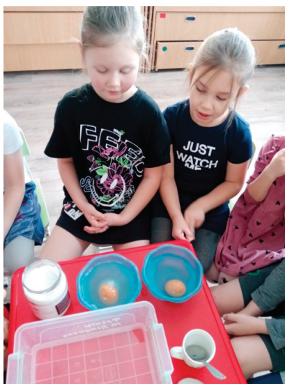
Свойства пресной и соленой воды