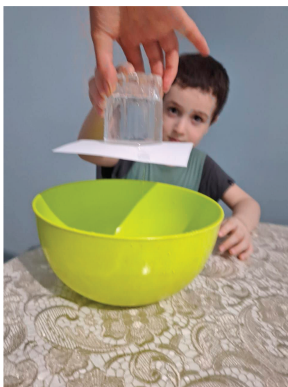
Действие давления воды внутри стакана на лист бумаги