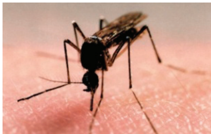
Рис. 2. Карточки для занятий в детском саду [2, с. 2]

Летит — пищит, ножки длинные тащит, Случай не упустит, Сядет и укусит. (Комар)