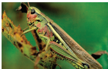
Рис. 1. Карточки для занятий в детском саду [2, с. 1]