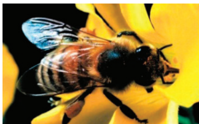
Рис. 3. Карточки для занятий в детском саду [2, с. 3]

Если пил ты чай с медком, с ней ты хорошо знаком. Много меда собирает и на чай нас приглашает. (Пчела)