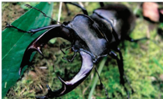
Рис. 4. Карточки для занятий в детском саду [2, с. 4]

Назовите насекомых, которые находятся на полянке (одно насекомое детям не знакомо). Логoped: это насекомое «Жук-олень» [3, с. 31], его прозвали так за огромные челюсти, которые напоминают ветвистые рога оленя. Это самый большой жук. Жук-олень обитает только в лесах. Рогами-челюстями он может прокусить даже кожу человека.