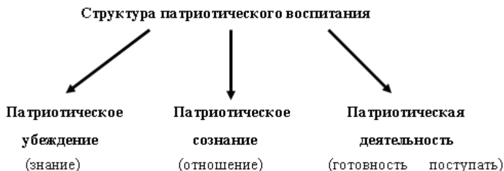
Рис. 1. Структура патриотического воспитания

Одним из направлений патриотического воспитания является кадетское движение. Кадетское образование и воспитание сегодня направлено на возрождение в молодёжной среде духа патриотизма, чести, ценности