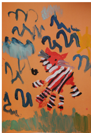
Рис. 1. «Веселый зоопарк», Маша Б., 5 лет

Итак, ряд занятий был посвящен технике рисования дартным материалом в изобразительном искусстве — оттиском: оттиск ладошкой (рис 1), оттиск нестандартным материалом в изобразительном искусстве — поролоном (рис 2, рис 3).