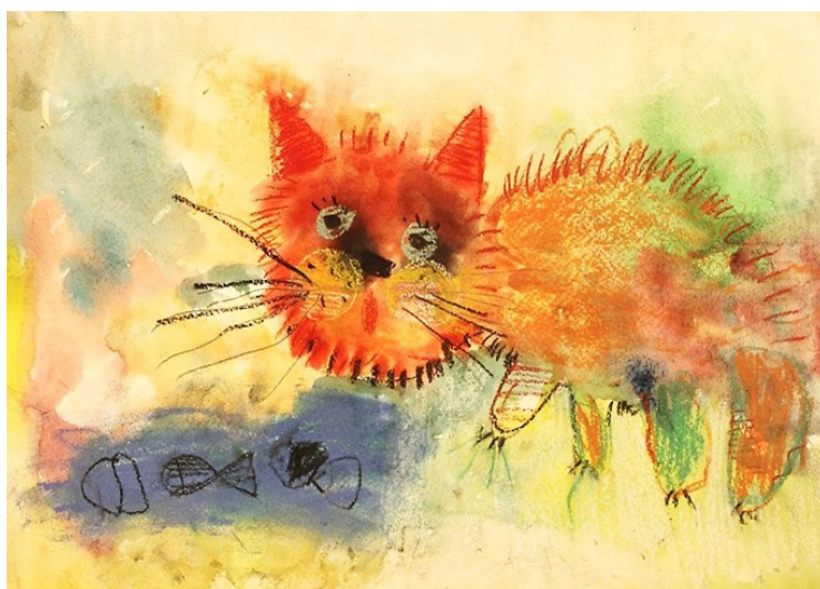
Рис. 5. «Кот, который ловит рыбу», Катя А., 5 лет

Мы показали часть заданий из программы, которая была апробирована на базе БДОУ г. Омска «Детский сад № 9 присмотра и оздоровления». Все задания в