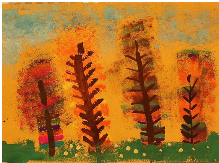
Рис. 2. «Осень золотая», Даша Л., 5 лет

При использовании поролона воспитанники выявляли для себя наиболее удобное использование этого материала: смешивали цвет на палитре и окунали кусочки поролона, смешивали цвет и наносили его на поролон, наносили несколько цветов, интуитивно пытались создать цветовую растяжку.