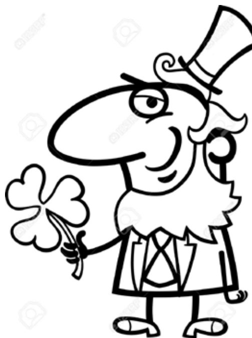
Леприкон и символ праздника трёхлистник.

Праздники Великобритании 17 марта ирландцы отмечают День Святого Патрика — покровителя Ирландии. В этот день они обязательно надевают что-то зеленое, в петлицы вставляют листки клевера-трилистника, который является символом Ирландии, надписи «Kiss me. I'm Irish» 23 апреля Англия отмечает день своего покровителя — Святого Георгия. В Лондоне центром народных гуляний становится Трафальгарская площадь. Флаги Англии, или флаги Святого Георгия — белые полотнища с красными крестами — в этот день украшают улицы английских городов, дома, магазины.