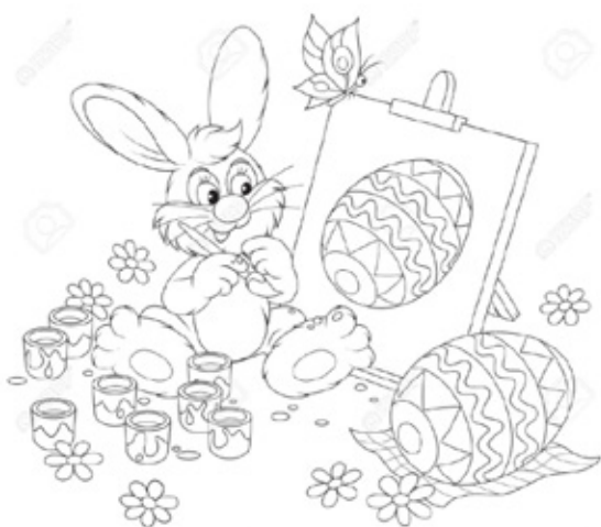
Пасхальный кролик готовит яйца к празднику

Пасха — христианский праздник в честь воскресения Христа, отмечаемый католической церковью в первое полнолуние после весеннего равноденствия между 22 марта и 25 апреля. Одно из главных различий, это что в Британии есть поверие о «Пасхальном Кролике», а в России нет. Дети Британии ходят в лес и ищут яйца на удачу, а в России дети ходят по домам, и дают тем, к кому пришли, яйцо с фразой «Христос Воскрес».