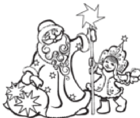
Дед Мороз и Снегурочка

Новый год — В России, нежели чем в Великобритании этому празднику уделено больше внимание. Если в Британии акцент идёт больше на рождество, то в России на Новый год. Рождество в России празднуется 7 января, а в Британии 25 декабря.