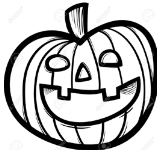
Важный символ хэллоуина — подсвечник из тыквы

смешения традиций, культур и обрядов. Америка обогатила этот праздник традицией «Трик-о-трет» (trick-or-treat), что можно перевести как «угости или подшутим над вами». Дети, наряженные в карнавальные костюмы, стучат в двери домов и требуют угощения — сладостей (подобный обычай существует и у славянских народов — колядки). Это любимый праздник детей во всех странах.