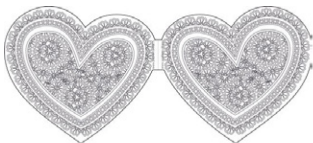
Валентинка – важный атрибут дня Св. Валентина

По истине это праздник более Британский, чем Российский, т. к. он и пришёл к нам оттуда. В этот день принято дарить Любимым и близким символику сердца, мягкие игрушки и т. п., чтобы показать свою любовь. В самом праздновании разницы нет.